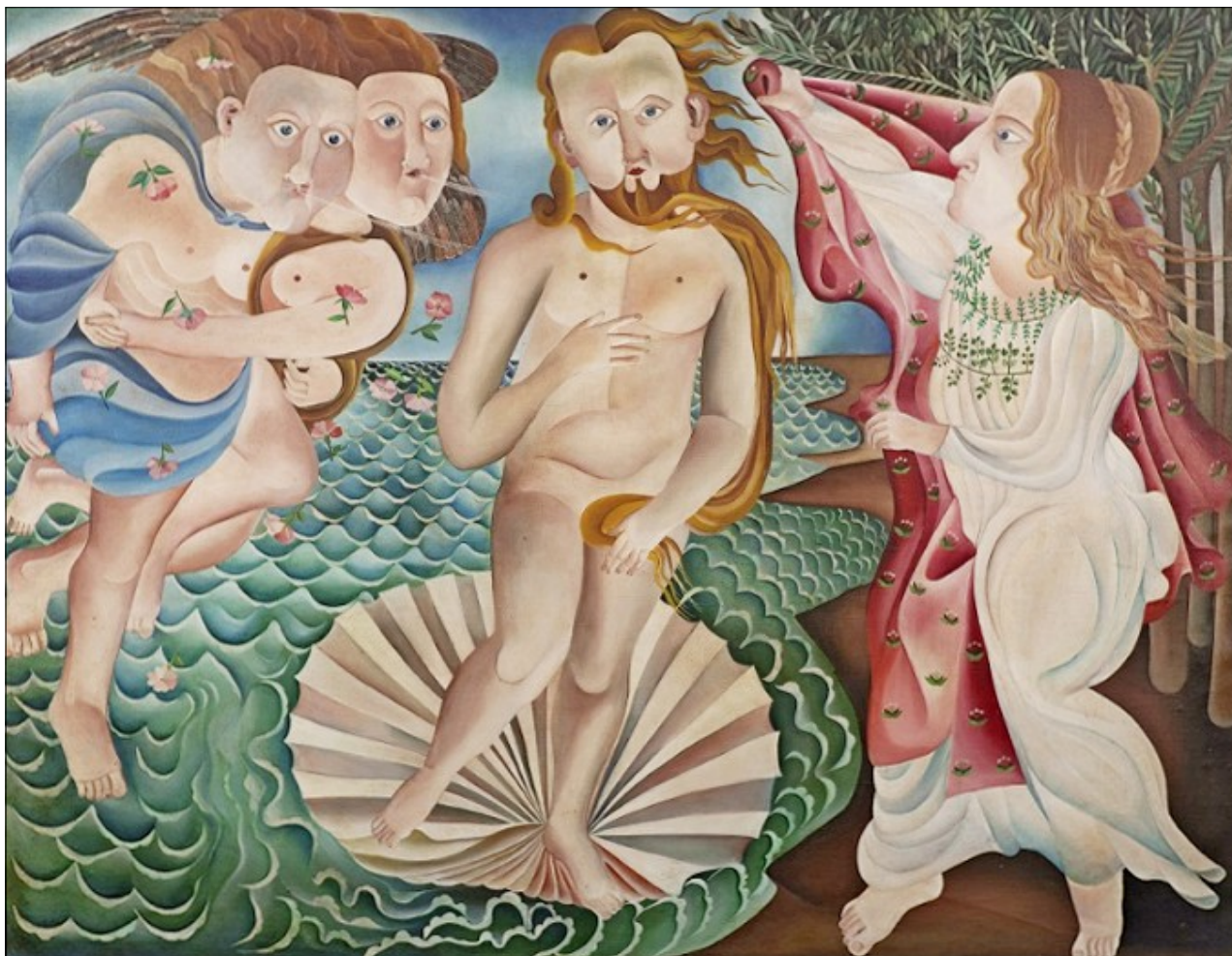
E. Š.: Zrození Venuše, 1968

Vystudovala řezbářství na průmyslové škole bytové tvorby a pak scénografii loutkového divadla na DAMU. Zásadní pro ni bylo setkání s Janem Švankmajerem, za něhož se roku 1960 provdala. V letech 1964–1968 byla členkou skupiny Máj a v roce 1970 spolu s Janem vstoupili do surrealistické skupiny v Československu, jejichž aktivit se účastnila až do své smrti.